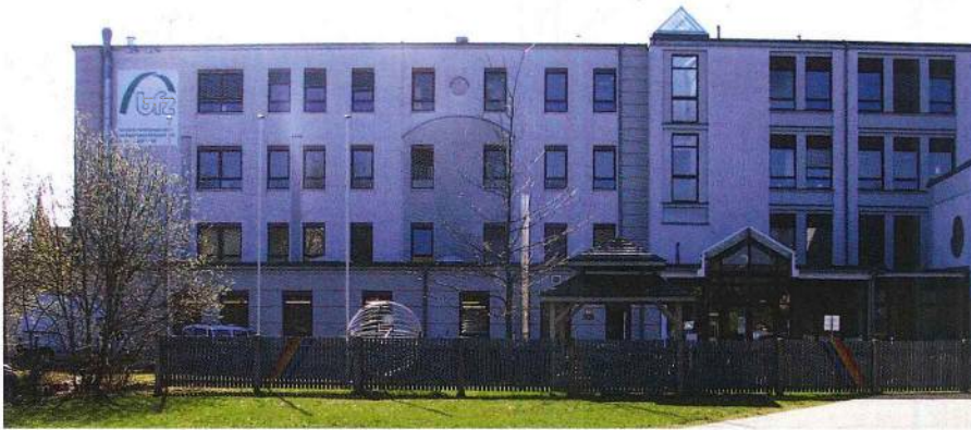
Berufliche Fortbildungszentren der Bayerischen Wirtschaft (bfz) in Hof